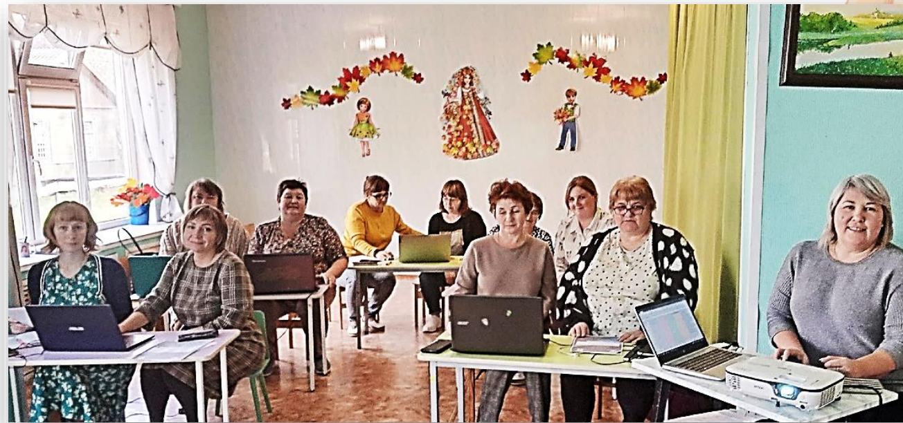
Семинар-практикум по составлению ИНФРАСТРУКТУРНОГО ЛИСТА. Сентябрь 2023.