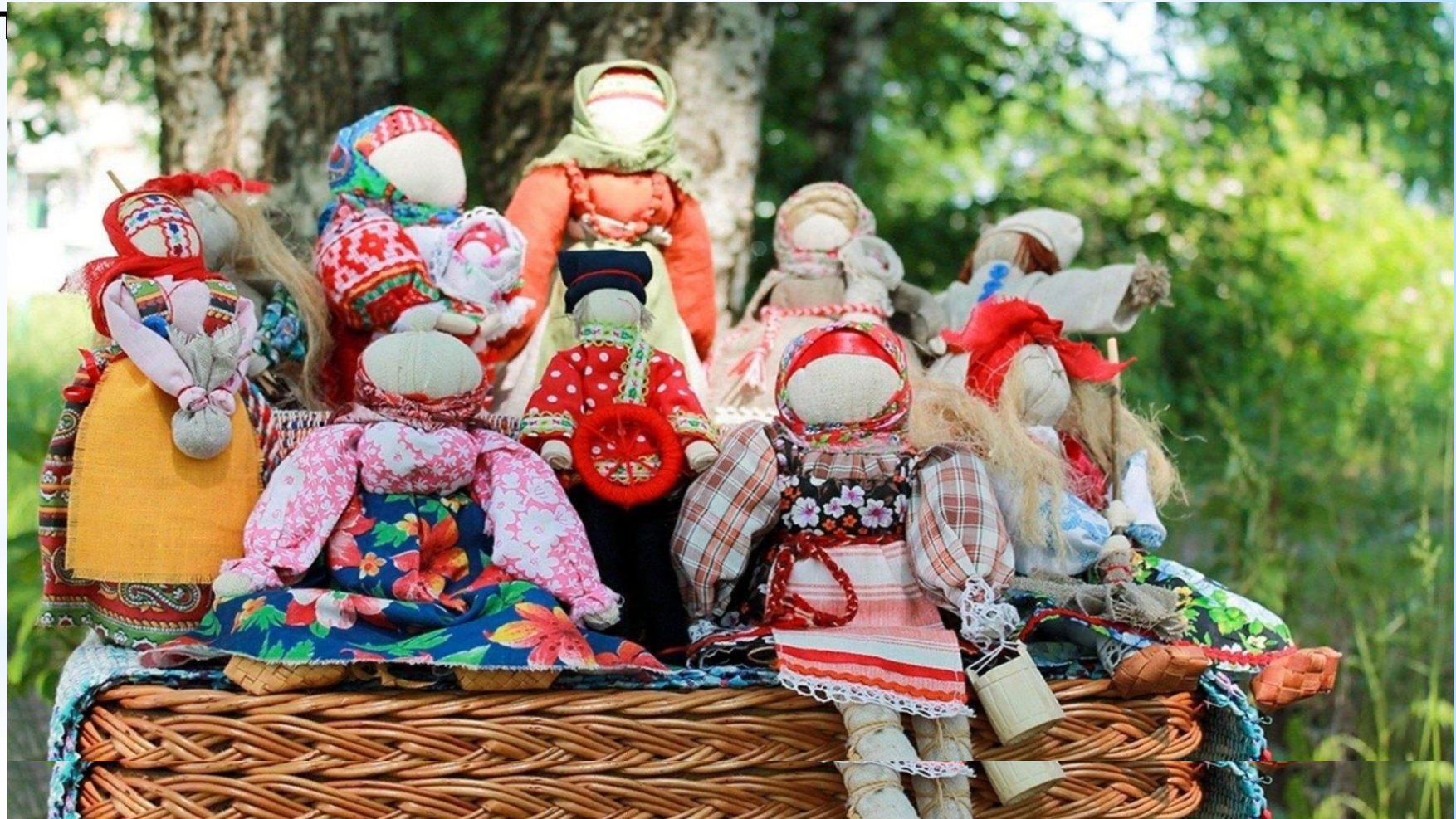
Народные обрядовые куклы

«За морями, за горами, За дремучими лесами На пригорке теремок, На дверях висит замок. В этот терем я вошла, И шкатулку (сундук) там нашел В этой шкатулочке (сундуке), только нет!