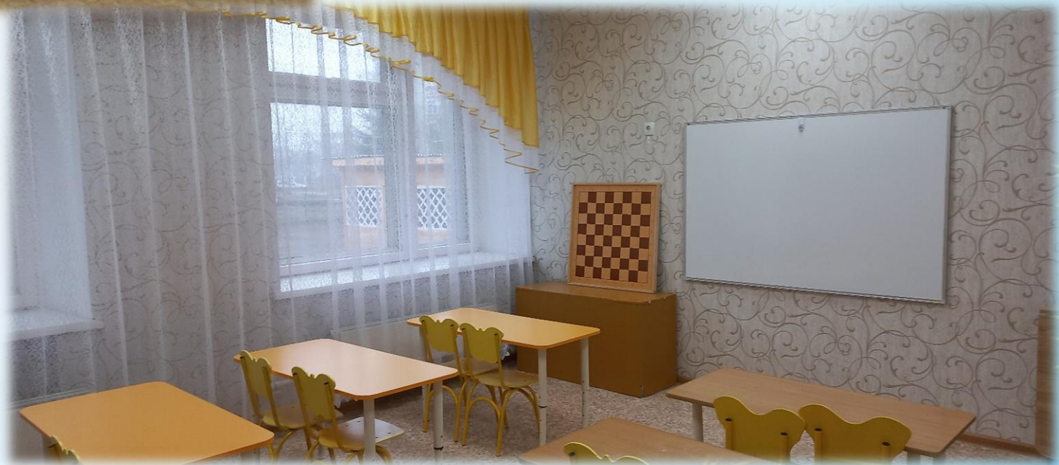
Комната для дополнительного образования