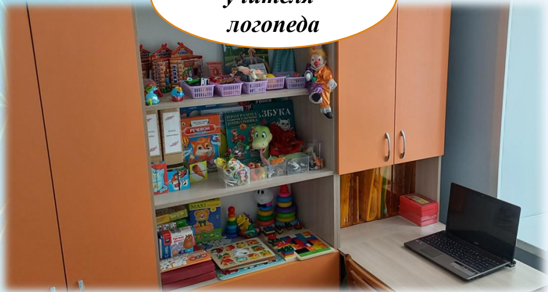
Кабинет учителя- логопеда