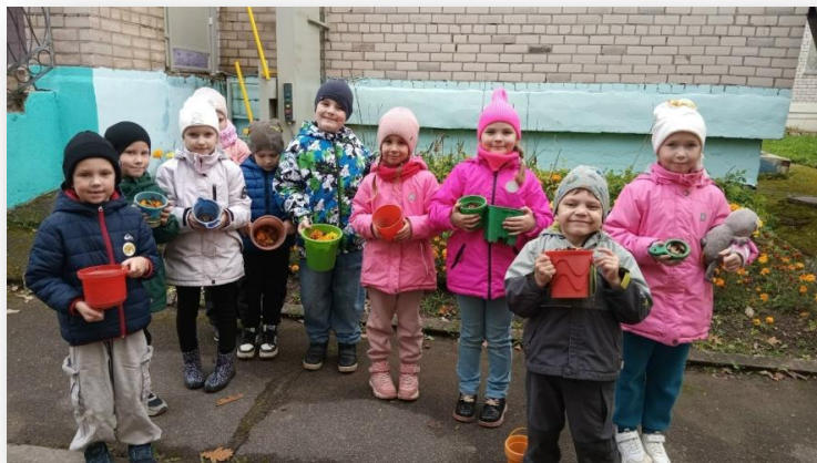
Акция «Соберем семена осенью – посадим весной!(сбор семян)

Все проводимые нами экологические экспедиции на улице мы заканчиваем творческой деятельностью или экологической акцией.