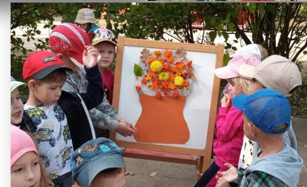
Творческая деятельность «Осенний и летний Лэнд-арт»