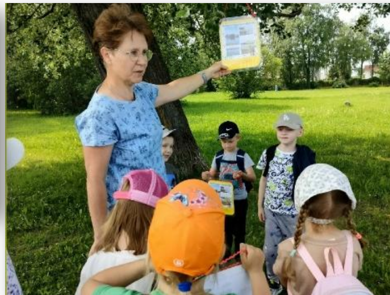
Акция «Берегите нашу реку Шексну!» (развешивание плакатов с правилами бережного обращения с рекой)