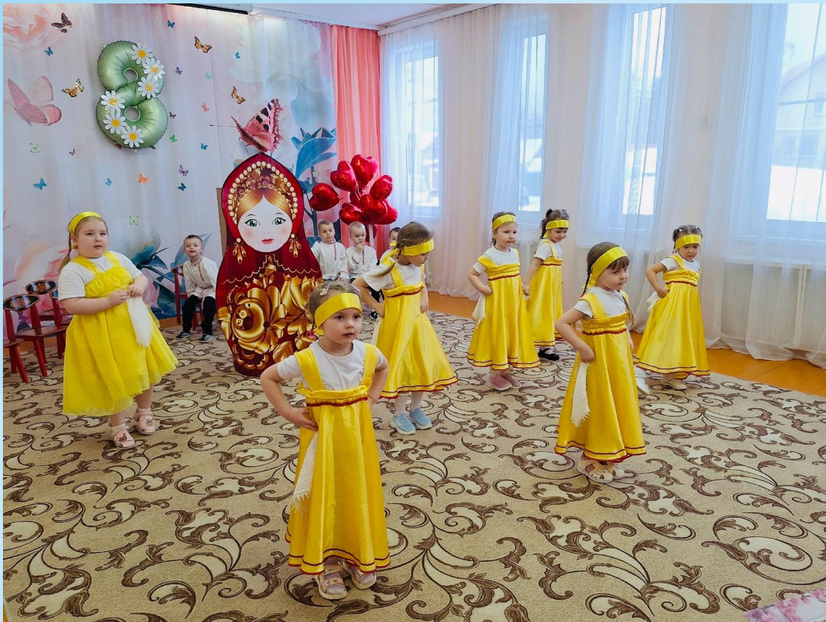
Танец «Русские матрешечки»