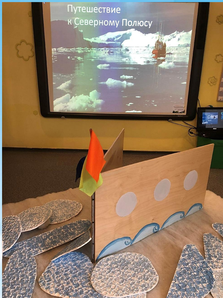
«Путешествие к Северному Полюсу»