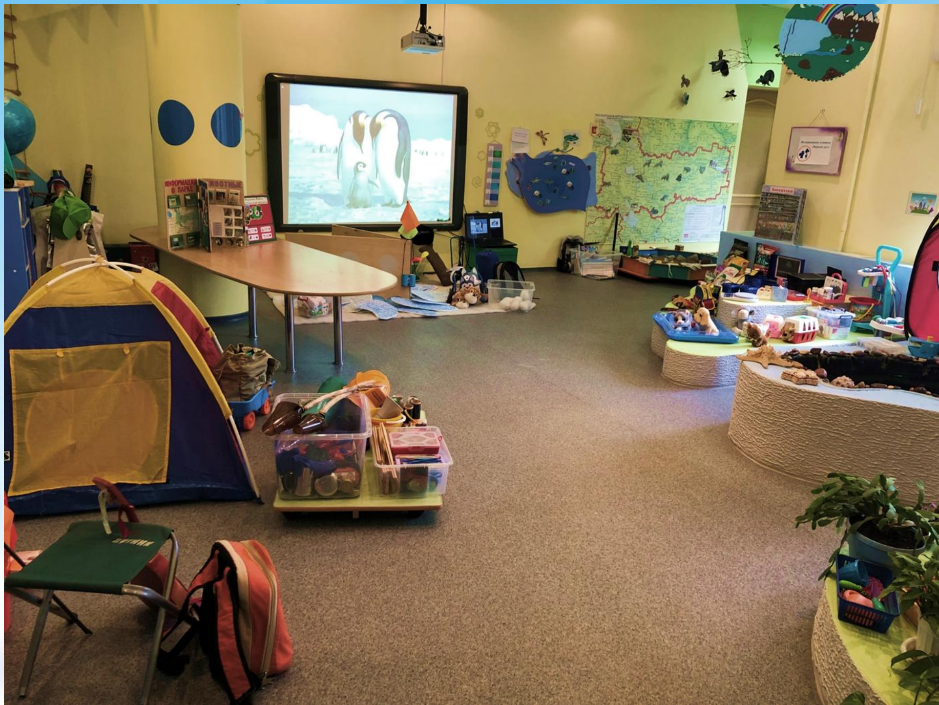
Общий вид «ЭКОИГРОТЕКИ»- центра сюжетно- ролевых игр по экологическому воспитанию